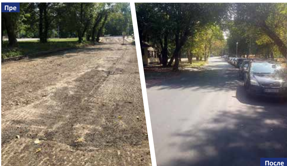
Улица Стјепана Филиповића

Вујовићева је похвалила сарадњу са ЈКП и додала да је са директором овог предузећа договорено да се додатно појача ангажовање екипа „Градске чистоће“ на општини Савски венац.