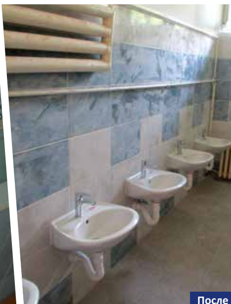
Вртић „Јелена Анжујска“

Један од приоритета Општине Савски венац је брига о деци и њиховим потребама, па је период летњег распуста искоришћен за извођење радова на текућем одржавању објеката основних школа на територији општине.