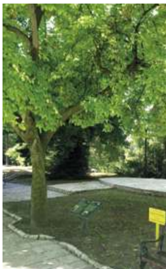
Дендометријске карактеристике стабла магнOLIје: висина стабла 9,77 m; обим стабла 1,74 m

Врт око Куће краља Петра Првог заштићен је као околина споменика културе, а у њему се налазе два споменика природе ботаничког карактера, стабло магнOLIје и стабло гинка, заштићено природно добро, старости око 110 година.