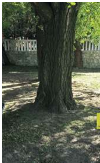
Дендометријске карактеристике стабла гинка: висина стабла 20,23 m; обим стабла 2,60 m

Својим разноврсним садржајима и атрактивним положајем на падинама некадашњих Топчидерских винограда, окружена вртом, Кућа краља Петра Првог представља незаобилазну тачку на културној мапи Београда.