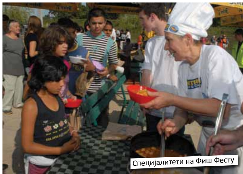
Специјалитети на Фиш Фесту

дому формирати позоришну секцију и помоћи им да направе своју представу, баш као што ћемо и најталентованије од њих, који су за то заинтересовани, укључити у „Малу школу рокенрола“ коју управо