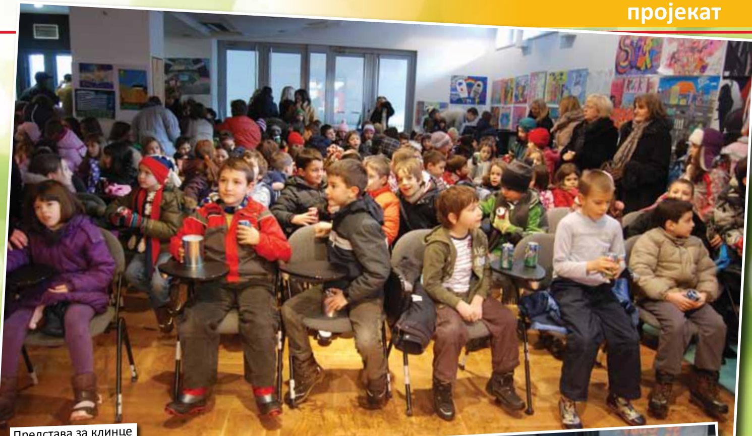
Представа за клинце