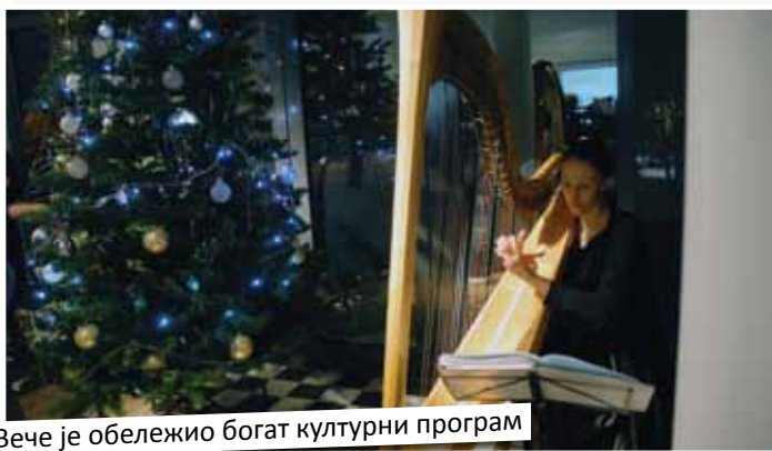
Вече је обележио богат културни програм

родитељима понудити више од обичног смештаја. У њој ће родитељи и деца моћи да се друже, као и