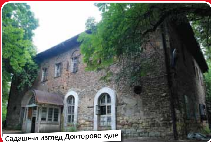
Садашњи изглед Докторове куле

Како би се прикупила средства за реконструкцију, 17. децембра је општина Савски венац у Кући краља Петра, организовала