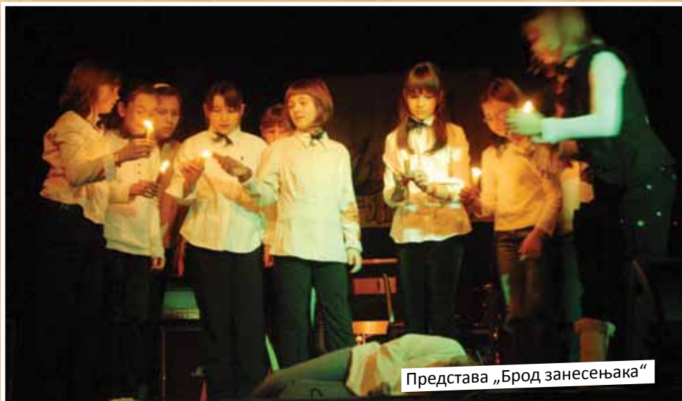
Представа „Брод занесењака“

А публику у препуној сали Театра 78 су и те вечери, 17. децембра, одушевили