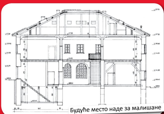
Будуће место наде за малишане