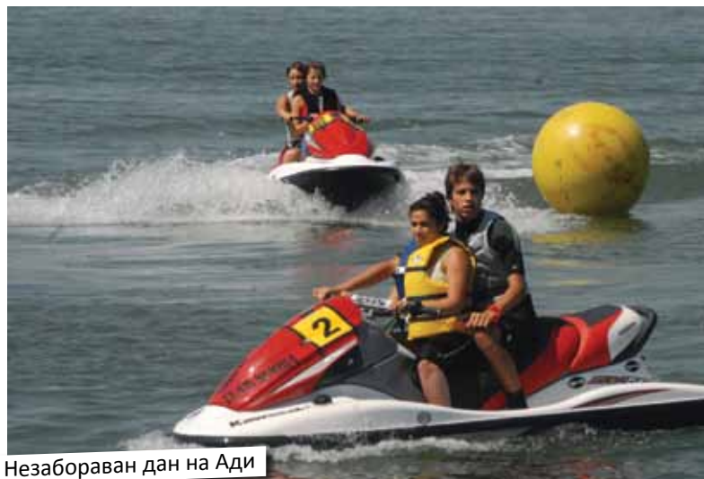
Незабораван дан на Ади

- Трудимо се, колико је у нашој моћи и колико имамо времена, а за ову децу га морамо имати, да им живот у дому учинимо лепшим и да осете сву љубав и пажњу коју им можемо пружити, каже