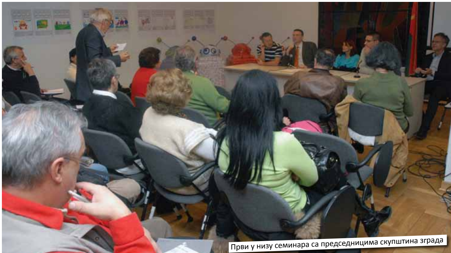
Први у низу семинара са председницима скупштина зграда

Од 24. новембра до 16. децембра, ГО Савски венац је организовала прва три семинара са председницима скупштина зграда, на којима им је уручено прво издање "ПРИРУЧНИКА за скупштине станара градске општине". Позиве за ове семинаре је до сада добило већ око две стотине председника скупштина зграда, што представља половину од броја конституисаних скупштина на територији општине. За остале скупштине зграда, организоваће се још неколико оваквих семинара, а за оне који нису у могућности да им присуствују, приручници ће бити дистрибуирани накнадно.