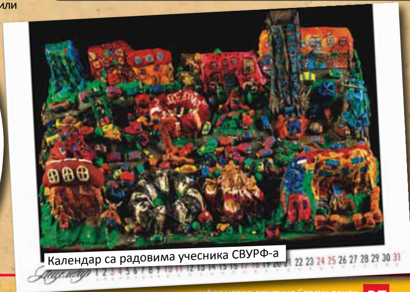
Календар са радовима учесника СВУРФ-а