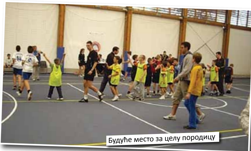
Будуће место за целу породицу

На тргу ће се налазити више справа за игру, љуљашке, клацкалице, тобогани, али и клупе и столови за мајке са бебама, а читав плато ће зарад безбедности најмлађих бити покривен