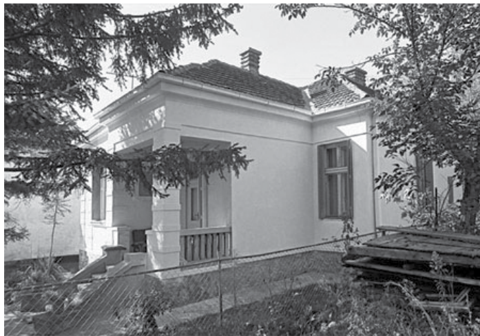
Кућа у улици Васе Пелагића где је живела Исидора Секулић

одатле становала и шетала управо тим парком.