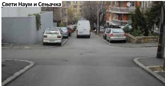
Свети Наум и Сењачка

На овој потпуно необележеној раскрсници судари су готово уобичајена ствар