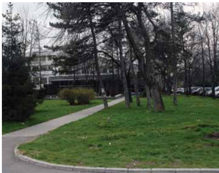
Локација предвиђена за централну општинску библиотеку