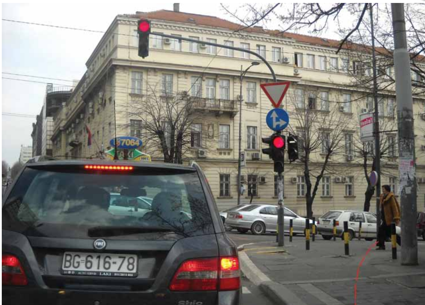
Раскрсница у Кнеза Милоша: Замишљена линија на тротоару којом би се скратила путања заокрета зглобних аутобуса и значајно убрзао проток возила