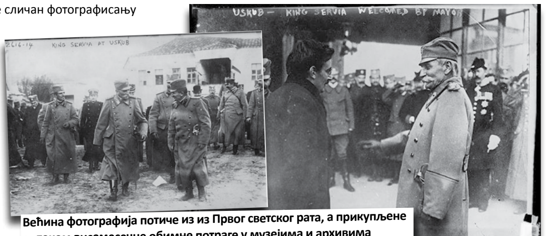
Већина фотографија потиче из из Првог светског рата, а прикупљене су током висемесечне обимне потраге у музејима и архивима

али је његов изглед забележен на фотографијама и у записима из тог времена. Оно ће, опет налик духовима чија невидљива обличја остају заробљена на месту које је некада било њихов дом, бити „призвано“ у једну од соба краљеве куће.