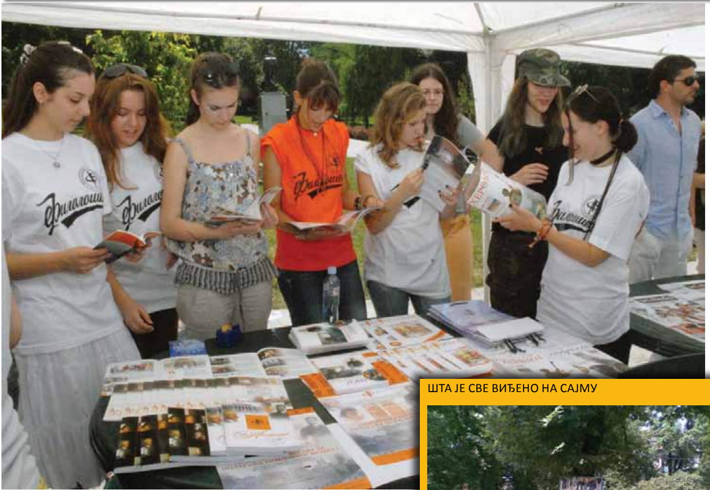
ШТА ЈЕ СВЕ ВИЂЕНО НА САЈМУ