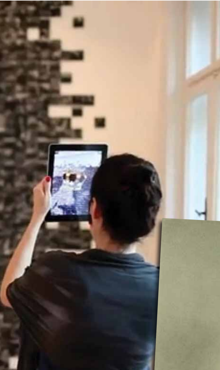
Велики портрет краља Петра I који сада краси Спомен собу творе стотине историјских фотографија