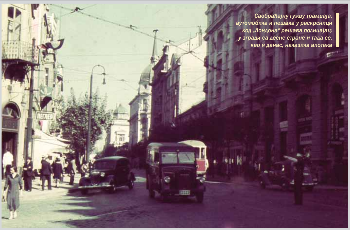
Саобраћајну гужву трамваја, аутомобила и пешака у раскрсници код „Лондона“ решава полицајац: у згради са десне стране и тада се, као и данас, налазила апотека