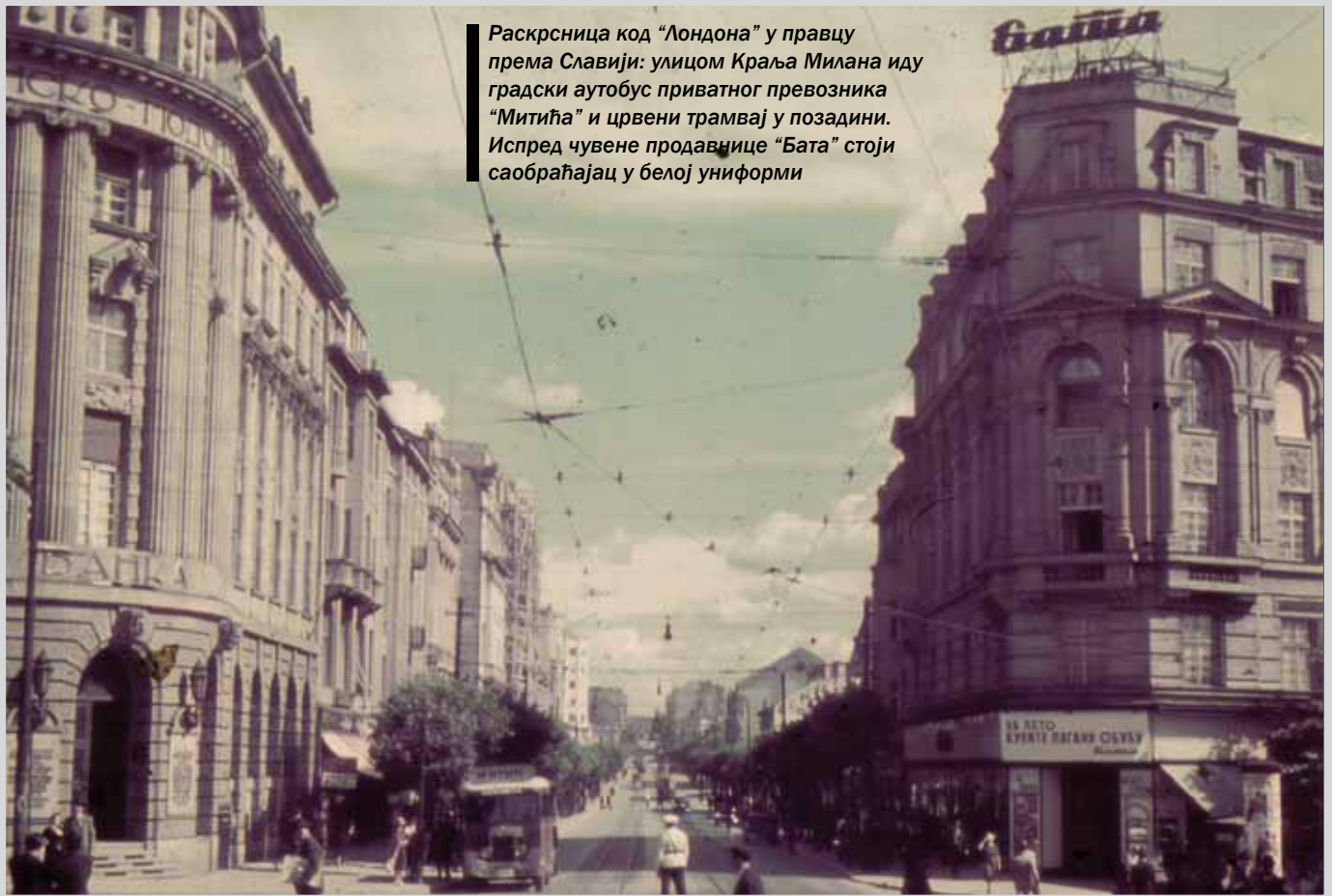
Раскрсница код „Лондона“ у правцу према Славији: улицом Краља Милана иду градски аутобус приватног превозника „Митића“ и црвени трамвај у позадини. Испред чувене продавнице „Бата“ стоји саобраћајац у белој униформи