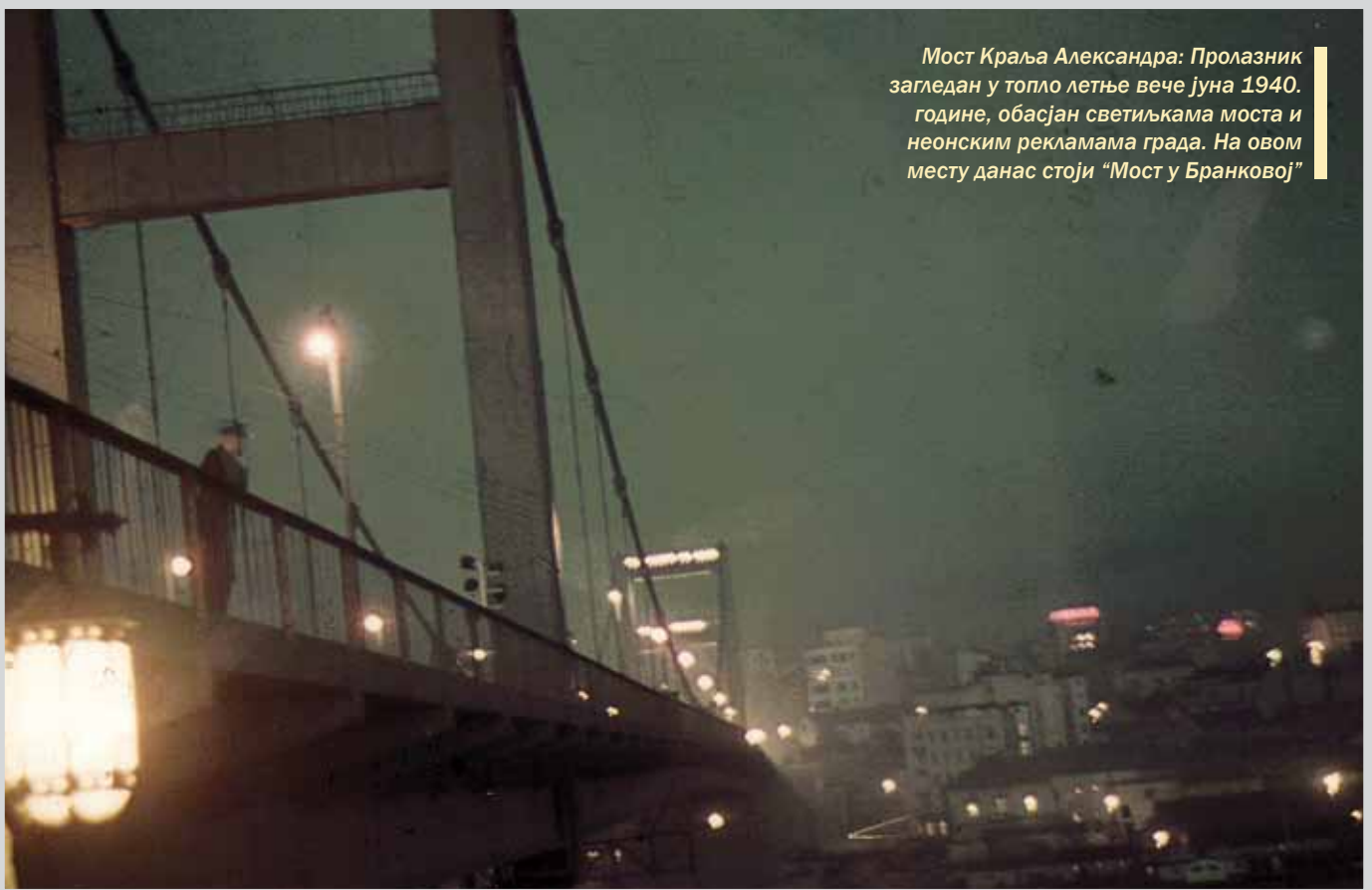
Мост Краља Александра: Пролазник загледан у топло летње вече јуна 1940. године, обасјан светиљкама моста и неонским рекламама града. На овом месту данас стоји “Мост у Бранковој”