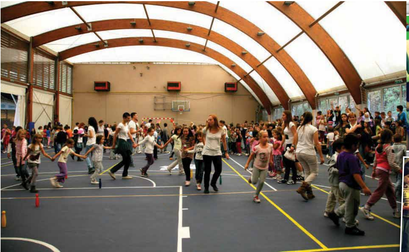
Дечји културни центар „Мајдан“