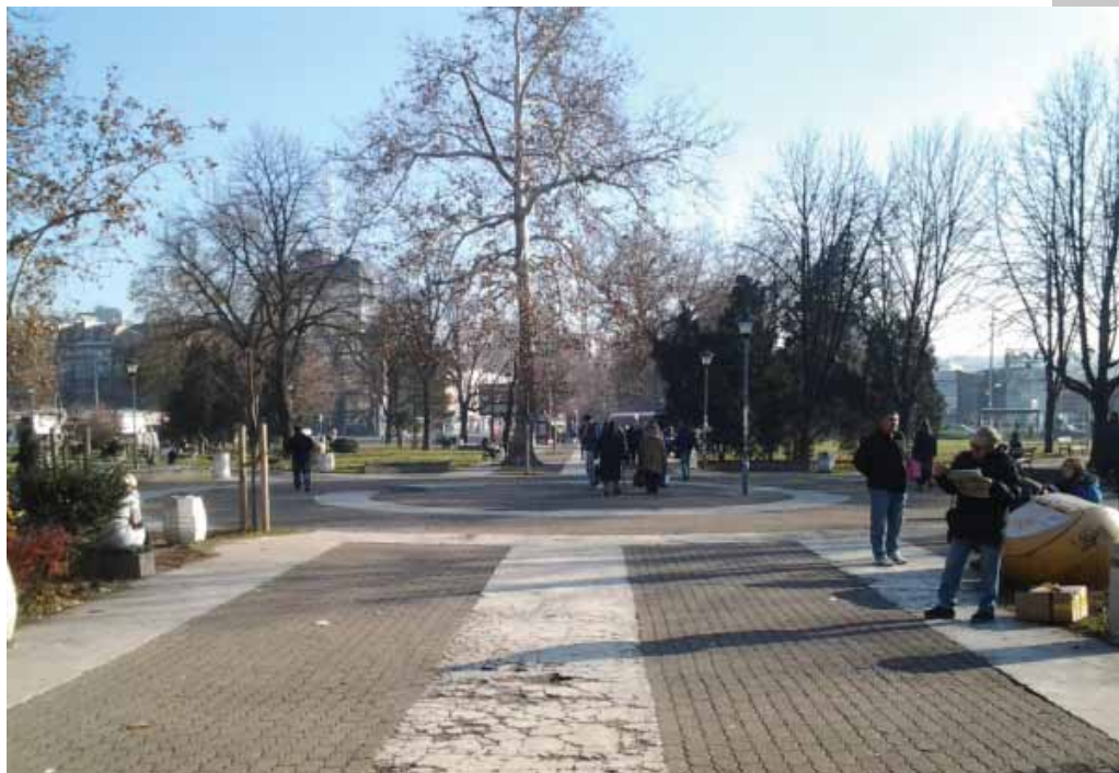
Садашњи и планирани изглед парка код Аутобуске станице

Град Београд има чак 19 капија! Две најпознатије су настале у модерном времену и носе називе “западна” и “источна” капија. Преостале датирају углавном из времена турске, аустријске, угарске владавине градом или деспотовине Стефана Лазаревића.