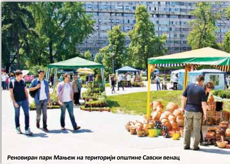
Реновиран парк Мањез на територији општине Савски венац

На нашој општини као и у случају француских, опет делимично, би се у ту категорију поставили парк код Милошевог конака тј. Топчидерски парк, Хајд парк, Парк 25 мај, парк-сума Бенцион Були, парк Газела, Финансијски парк ( угао Немањине И Балканске улице према А.Гепрата ) и слични.